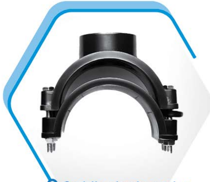
○ Saddle single outlet