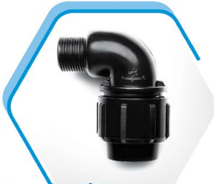
90° Elbow with Threaded male offtake