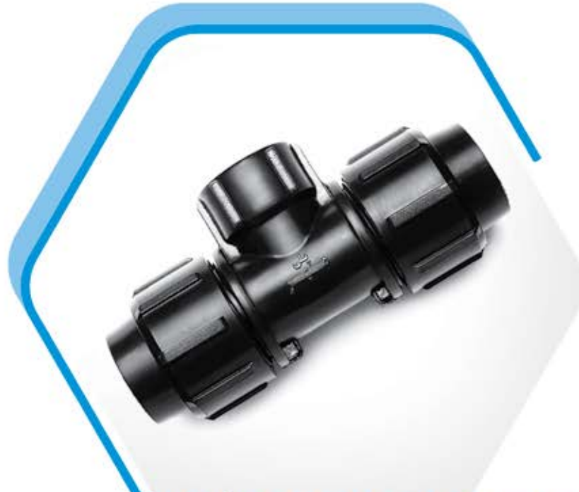
90° Tee with Threaded male offtake