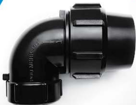
90° Elbow with Threaded Female offtake